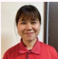
街なかデイサービス 和音 ミニ (ミャンマー)

【質問】①日本の好きどころ ②日本で行ってみたい場所 ③好きな食べ物 ④休日の過ごし方 ⑤介護の仕事をしてみて感じたこと