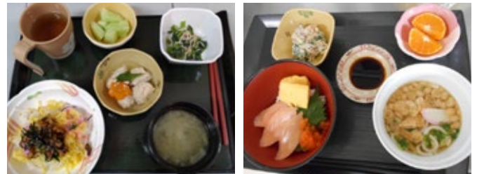
栄養管理士によるメニュー